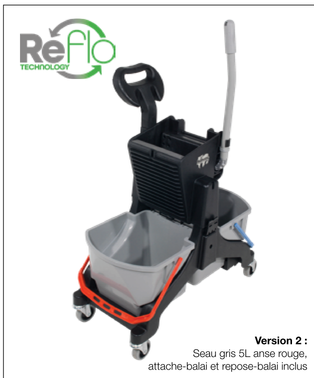
Seau 5L anse rouge