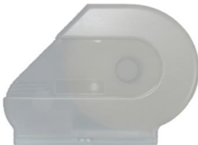
MAXI JUMBO « RÉSERVA »