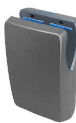
AA24950 8427950360626 Finition graphite