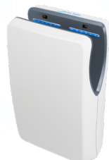
AA24050 8427950360596 Finition blanche