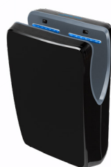
AA24650 8427950360619 Finition noire