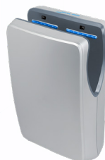
AA24550 8427950360602 Finition argentée